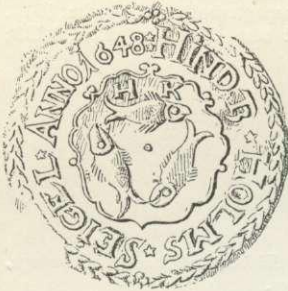
Hinsholm Segl 1648.