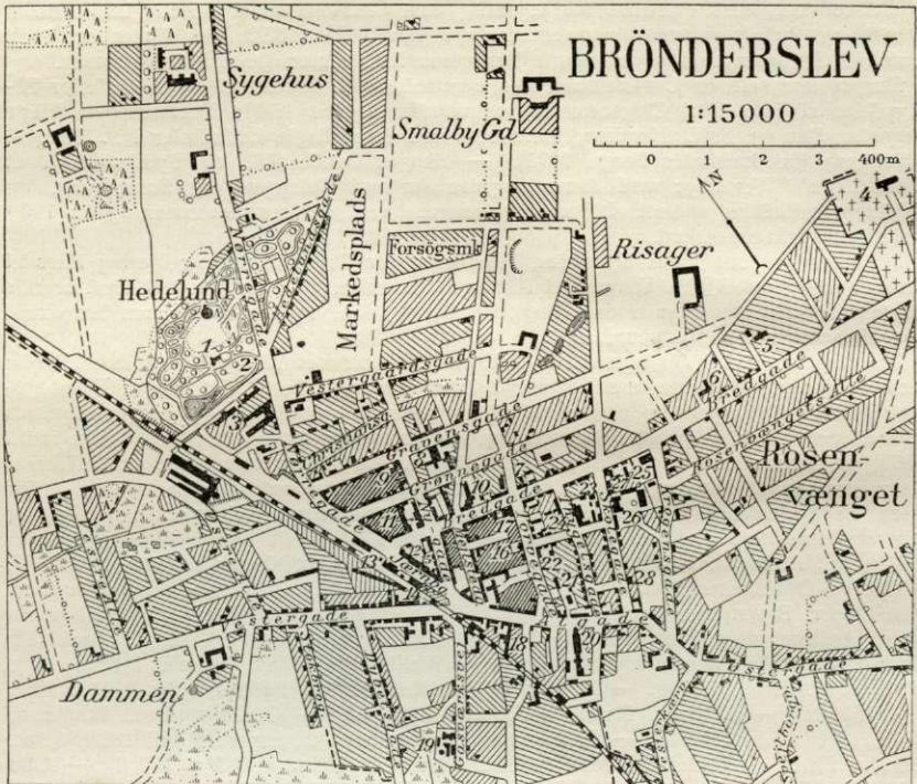
Efter Generalstabens Revision, 1922.

Udstrækning fra Ø. til V. er c. 1500 m, fra N. til S. godt 1000 m. Den er opvokset efter Jærnbanens Anlæg, og Hovedgaden er den tidl. Landevej Bredgade, der efter at have passeret Jærnbanen fortsætter sig mod V. under Navnet Vester-gade. Fra Jærnbanegade fører mod N. Nørregade og mod Ø. Algade, der fort-sætter sig i Østergade. Mellem Algade og Bredgade og de med disse parallelt løbende Gader Grønnegade og Gravensgade gaar et Net af Tværgader (Nygade,