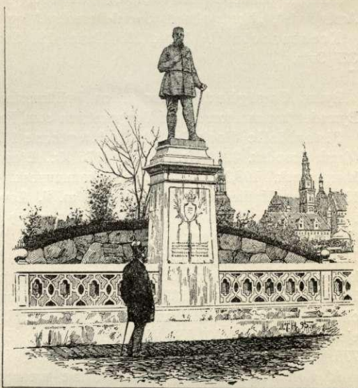
Frederik VII's Statue paa Torvet i Hillerød.

Første Onsdag i hver Maaned (undt. Marts, Maj og Novbr.) og 3. Onsdag i hver Maaned er der Marked med Kreaturer; i Marts er der stort Hestemarked,