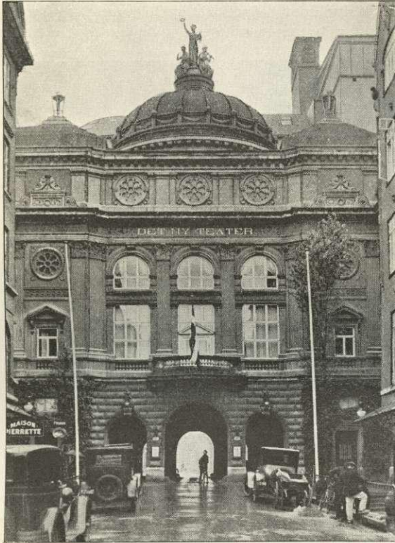
Det nye Teater.

Ved Lov af 21 / 3 1928 er det vedtaget at udvide Teatret med en Tilbygning i