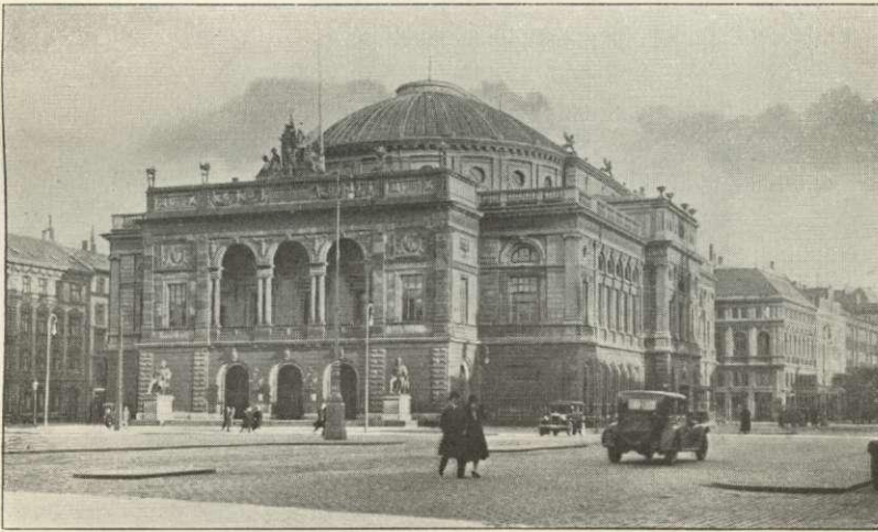
Det kgl. Teater.

spilledes paa Hofteatret) under Ledelse af Harsdorff og for en Sum af 32,769 Rd.; bl. a. opførtes en Tilbygning (med Frontespice af Weidenhaupt) med Vestibule ud mod Torvet og to Tilbygninger til Paaklædningsværelser ud mod Holmens Kanal samt et Trapperum paa Sidefacaden mod Gjethuset; Tilskuerpladsen, der var smykket med Portrætter af Sofokles, Plautus, Corneille og Holberg, udvidedes til 1000 Pladser, Scenen forstørredes og fik den bekendte Overskrift: „Ej blot til Lyst“ (atter nedtaget 1798, men genopsat 1813), og foran Prosceniet anbragtes Statuer af Tragediens og Komediens Muse (af Wiedewelt og Weidenhaupt), rigtig nok kun af „Tømmer, Pap, Gibs og Sejldug, overdraget med Limvand og melert med Kridt“. Efter at Kapelmester Sarti havde haft uindskrænket Bestyrelse over Teatret 1770-72, kom det ind under en kgl. Kommission, der foreløbig skulde