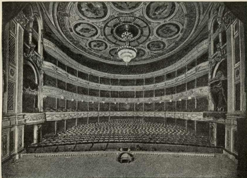
Det kgl. Teaters Tilskuerplads.

Først senere og lidt efter lidt fik Teatret sin kunstneriske Udsmykning; saaledes fuldendtes den i Kongelogens Salon (med Loftsdekoration af Aagaard) og Trappegang i Sommeren 1881, og Tilskuerfoyeren med Loggiaen, der har rig Dekoration