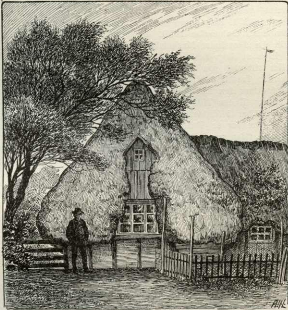
Tangtækket Hus ved Byrum.