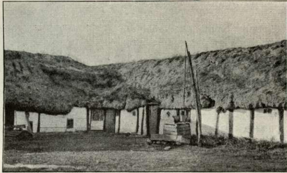
Gaardsplads i Byrum.

88 forekom der i alt 624 Strandinger, hvoraf 239 var totalt Forlis. Men nu er de sjældnere paa Grund af de gode Fyr. Allerede tidlig havde Regeringen Øje for, at der maatte gøres noget for de søfarende; \frac{8}{10} 1560 udgik der Kongebrev om, at der ved Trindelen skulde udlægges en Tønde med Klokke, og Dagen efter fik Viborg Kapitel Ordre til at træffe Aftale med „nogle forstandige Bønder“ paa Læsø om at passe paa Tønden, tage den op om Vinteren