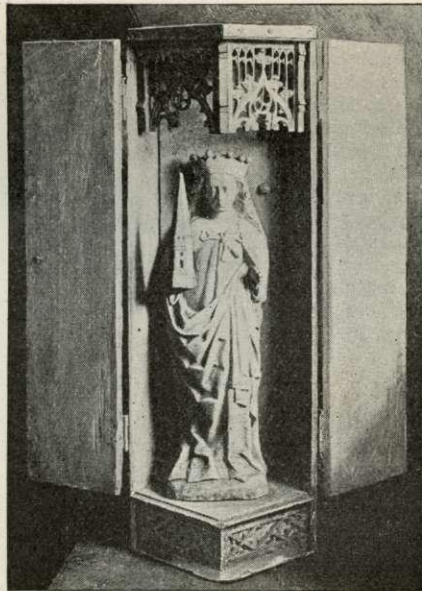
Skt. Barbara i Byrum Kirke.

Den ret anselige Kirke (udvendig c. 35 m lang) bestaar af Skib og Kor ud i eet med tresidet Afslutn., et 20,7 m højt Taarn mod V., Vaabenhus mod N. og Sakristi ved Korets Nordside. Kirken er opf. i gotisk Stil af store, gule Mursten; samtidig med Skib og Kor er Taarn og Sakristi, hvorimod Vaabenhuset er fra Middelalderens Slutn. Bygningen er vist undergaaet store Forandringer allerede i Middelalderen; Norddøren er bevaret i Vaabenhuset, Syddøren er tilmuret. Alle Kirkens Dele er hvælvede; Taarn, Sakristi og Vaabenhus har blindingsprydede Kamgavle. Katolsk Altertavle fra c. 1450 med Fløje og 24 Figurer: I Midtpartiet Marie Himmelkroning, i øvrigt i øvre Række Helgener, i nedre Apostle; over Topstykket er anbragt et sentgotisk Krucifiks (c. 1525); Aarstallet