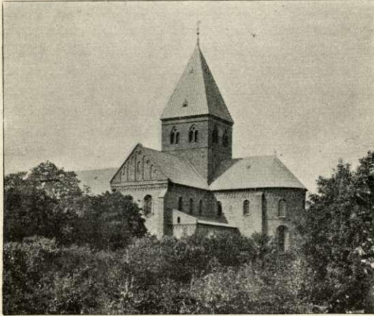
Skt. Bendts Kirke.

Svend Norbagger i Slutn. af 11. Aarh.; det var en enskibet Fraadstenskirke med halvrund Apsis i Ø. og en Bredde omtr. svarende til det nuv. Midtskibs. Ved de seneste, omfattende Istandsættelsesarbejder fandtes under Gulvet Rester af dens Grundmur, hvorved dens Materiale og Grundplan for første Gang er konstateret: Apsiden har ligget omtr. midt mell. de to Arkadepiller V. for Korskkæringen. I denne Kirke bisattes Knud Lavard efter Mordet i Haraldsted Skov \frac{7}{11} 1131. Skjalm Hvides Sønner, der for at hævne deres Fosterbroder paa sjæll. Tingmøder ophidsede Folket ved at fremvise hans blodige Kappe, ønskede for at hædre hans Minde at føre Liget fra Haraldsted Kirke til Rosk. Domkirke, hvor alt saa mange af hans berømmelige Forfædre hvilede. Men Kong Niels frygtede, at