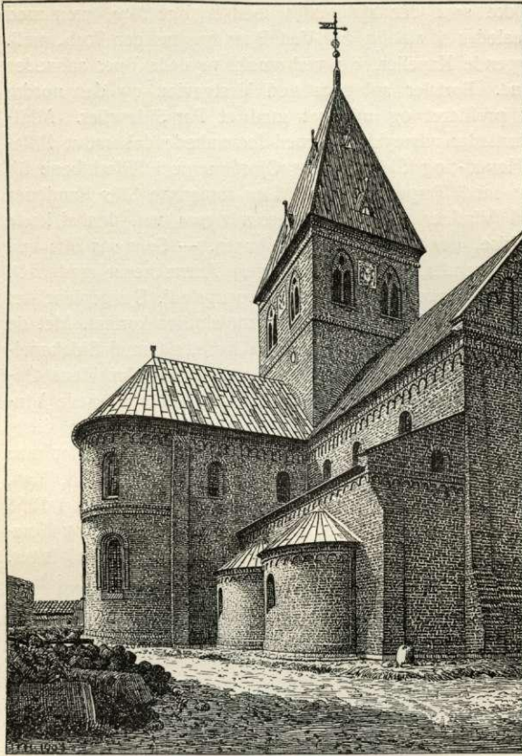
Korparti af Skt. Bendts Kirke.

i Sorø kgl. Bef. til at skaffe Abbeden i R., hvad han behøvede til Kl.s og Kirke-taarnets Istandsættelse). Men i øvrigt har Kirken vistnok ikke undergaet større Forandringer før efter den ødelæggende Brand 21/6 1806, der begyndte i det til Kirken umiddelbart stødende R. Kl. Vel udholdt Hvælvingerne for største Delen Vægten af det nedstyrtende brændende Spir og de halvsmedede Klokker — Hvælvingerne i søndre Sideskib, der vistnok var nye og af Bræddeværk, faldt dog for en Del