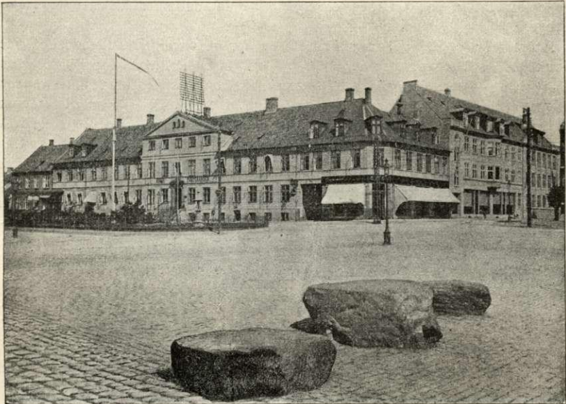
Torvet i Ringsted med Hotel Postgaarden.