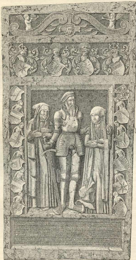
M. Olufsen Krognos Ligsten.

Af mærkelige Ligstene og andre Mindesmærker i Kirken nævnes des-