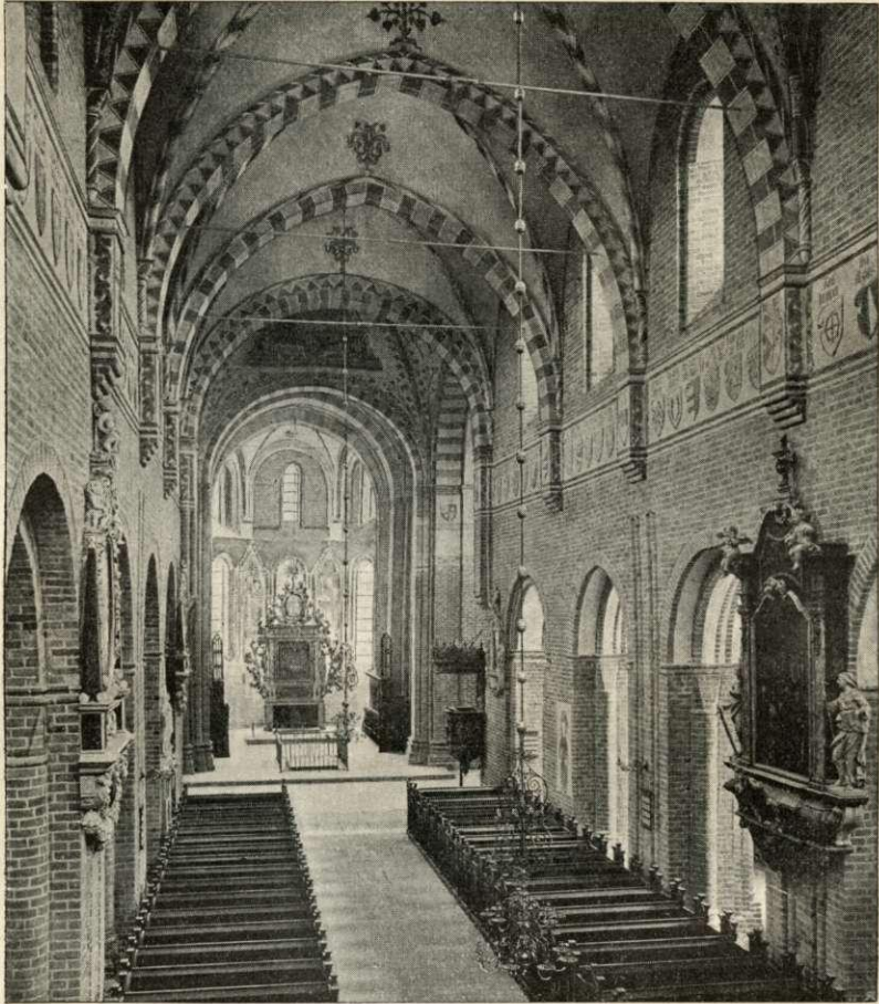
Skt. Bendts Kirkes Indre.

Række af Grave blev dog ikke uberørt i Tidens Løb. Den eneste bevarede oprindl. Gravplade er den over Erik Menved og Dronn. Ingeborg , der ligger midt for Indgangen til Koret kort Ø. for Kongeparrets Grave (se ndfr.), og som nu er den eneste tilbageværende af sit Slags i Danmark (restaur. 1883). Det er en svær, c. 2,7 m lang og 1,7 m bred stukket Messingplade, der ligger over en sort Marmorsten, og paa hvilken er indgraveret i brede Omrids de afdødes Skikkelser