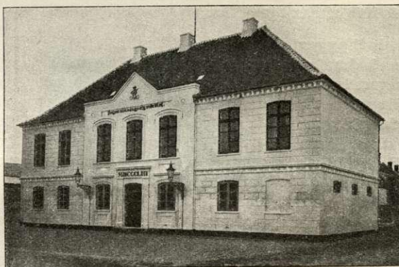
Raadhuset i Rødby.

Gasværket , Fruæg., er anl. 1896. — Elektricitetsværket , Ø.-Allé, anl. 1913 som Højspændingsværk med Dieselmotorer; 1918 udvidet med Dampanlæg (paa Gr. af Oliemangel); Maskinkraften c. 800 HK; Anlægssum i alt c. 1 Mill. Kr. Værket forsyner Ringsebølle, Sædinge, Erindlev og Olstrup Sogne med Strøm; Prod. 1920 c. 700,000 KWT. — Vandværket , i Ringsebølle, anl. 1905 af et A/S, 1916 overtaget af Kommunen; det drives automatisk ved elektriske Pumper. Vandtaarnet er 36 m højt.