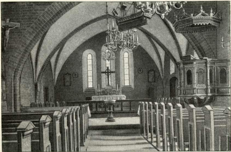
Rudkøbing Kirkes Indre.

vistnok den Gang en muret Begravelse, der laa mellem den nordl. Korsfløj og Sakristiet, og som var opf. af Cl. Bertelsen. Paa Grund af Korhælvvingernes delvise Nedstyrtning 1896 blev den atter restaureret (indviet 20/12 1896) under Ledelse af Arkitekt H. F. J. Estrup, hvorved den saa vidt muligt er ført tilbage til sin oprindelige Stil. Korhælvvingerne genopførtes, Murene blev baade ud- og indvendig rensede og staar nu med Teglenes røde Farve, Vinduerne i Korgavlens, der var blevet tilmurede, blev atter aabnede, ligeledes det rundbuede Vindue paa Korets Sydside (i Hovedskibet aabnedes de ikke paa Grund af Lysvirkningen), og Taarngavlene, der var blevet ændrede 1835, fik deres oprindelige Stil (Restaurationen kostede 24,000 Kr., hvoraf Staten ydede Halvdelen). Den gl. Altertavle fra