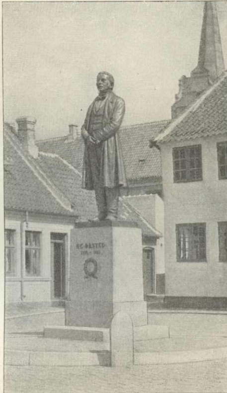
H. C. Ørsted's Statue.

Af Mindesmærker nævnes: Paa Gaasetorvet er 21/7 1920 afsløret en Bronze-